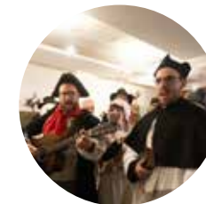
Novembre La Saint-André