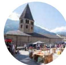
Juin Troc et Puces