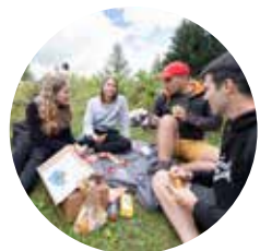
Août Rendez-vous à Loutze Fête nationale