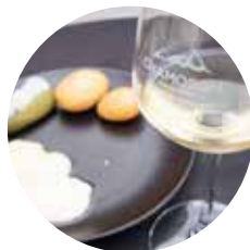
Mai Vinissima Les Caves Ouvertes