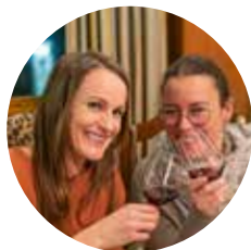
Février Soirées Vinum Montis